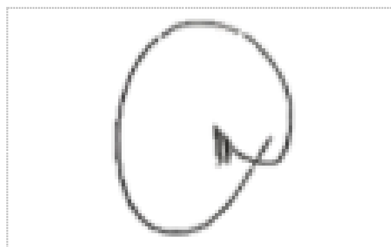
Assinatura de NEWTON ALFREDO MAGALHÃES

ZapSign Token: ca18df9d-****-****-****-53e9620b5bd1