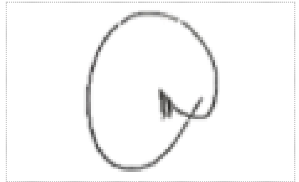
Assinatura de NEWTON ALFREDO MAGALHÃES

ZapSign Token: ebda1629-****-****-****-5f5dd9495031